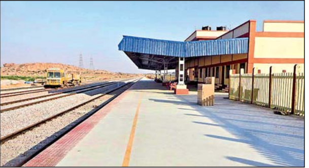
రైల్వే స్టేషన్లోని ప్లాట్ ఫారం