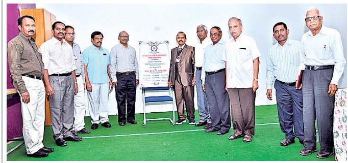
ఇటీవల సమావేశమైన పూర్వ విద్యార్థులు