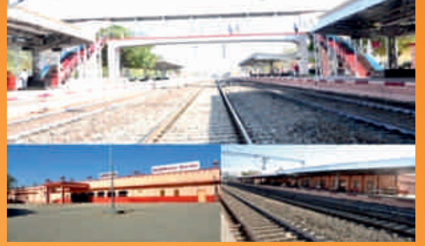
रामगंज मण्डी स्टेशन के उन्नयन का कार्य