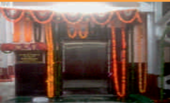
कोटा स्टेशन पर लिफ्ट