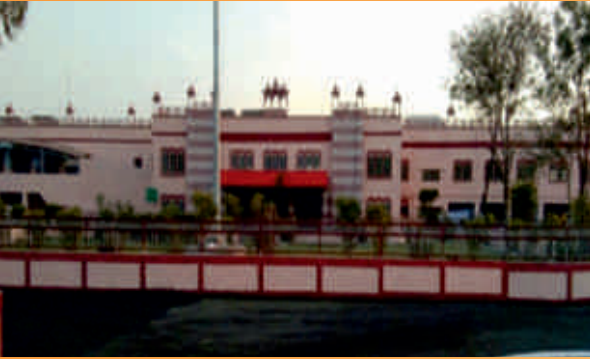
बूंदी स्टेशन के उन्नयन का कार्य