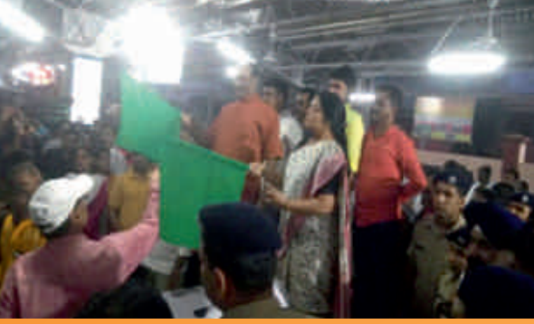
श्री ओम बिड़ला, माननीय सांसद-कोटा, कोटा-जबलपुर एक्सप्रेस को कोटा स्टेशन से हरी झण्डी दिखाकर रवाना करते हुये