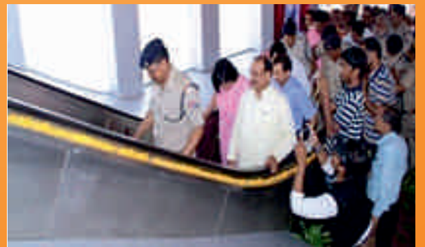
श्री ओम बिड़ला, माननीय सांसद-कोटा, कोटा स्टेशन पर एस्केलेटर का शुभारम्भ करते हुए