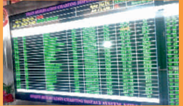
कोटा स्टेशन पर ऑनलाईन पेपरलेस रिजर्वेशन चार्ट