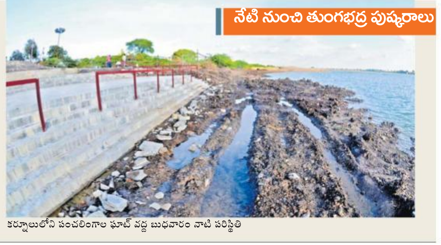
కర్నూలులోని సంకల్పాగల ఘాట్ వద్ద బుద్ధవారం నాటి పరిస్థితి