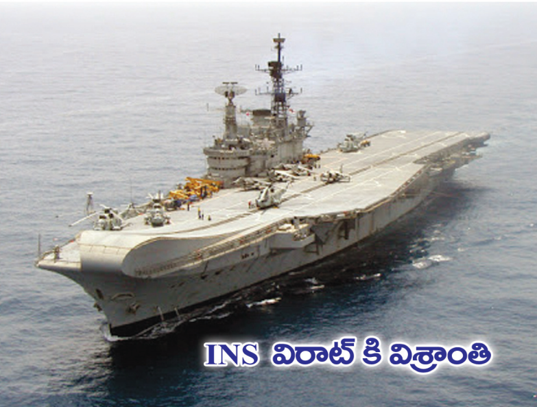
INS విరాట్ కి విశ్రాంతి