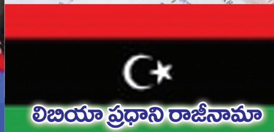
విబియా ప్రధాని రాజీనామా

UPSC PCM | Group - I & II Inter + IAS | Degree + IAS CLAT | SSC-CGL