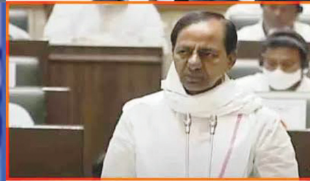
తెలంగాణ నూతన రెవెన్యూ చట్టం