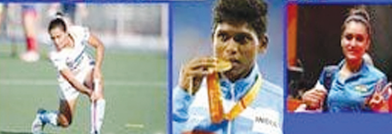
జాతీయ క్రీడా పురస్కారాలు