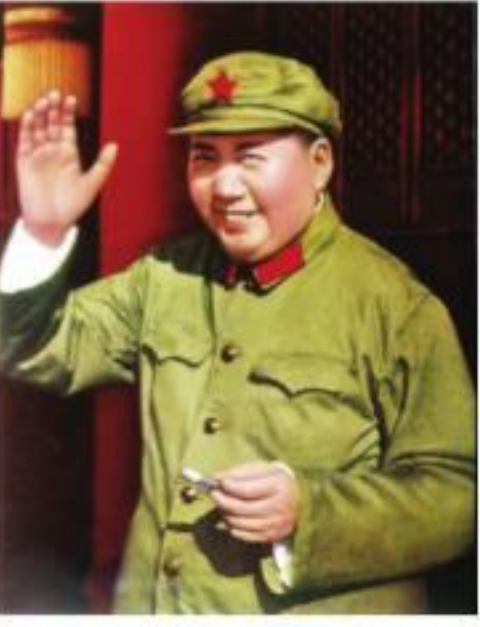
తప్పలు బిద్దుకోవడానికి కమ్యూనిస్టులు ఎల్లప్పుడూ సిద్ధంగా వుండాలి. ఎందుకంటే, తప్పలు ప్రజా ప్రయోజనాలకు వ్యతిరేకమైనవి.